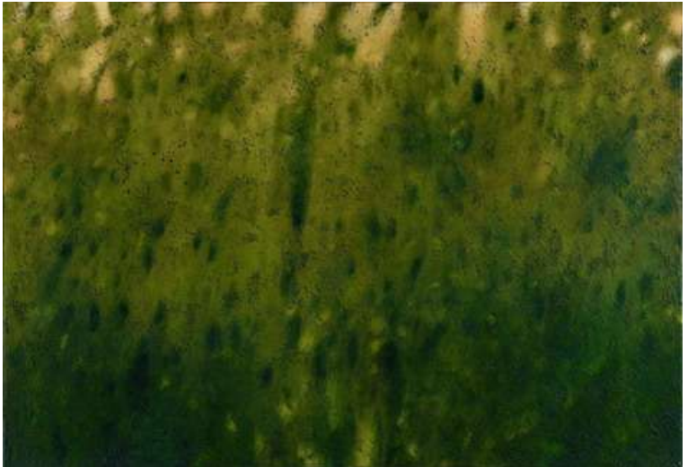
Viaggio, 2003, acrilico e olio su tela, 90x130 cm.