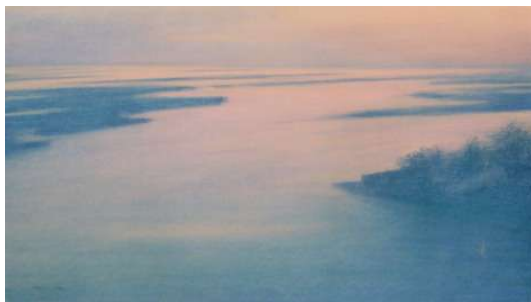
Graziella Da Gioz, Nella laguna, 2005 pastello su cartone, 46x80 cm.

Per cavalleria è bene iniziare da Graziella Da Gioz, il cui viso ricorda i dolci incarnati di fanciulle di corte ritratte nei bas de page dei libri d'ore e nelle miniature di Giovannino de' Grassi. Un'artista che ama concentrarsi periodicamente su cicli tematici diversi: il cielo,