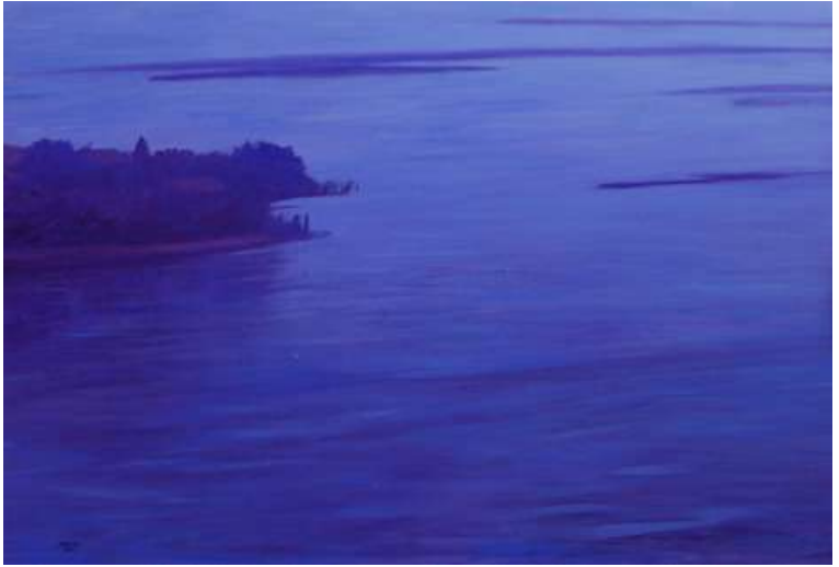
Isola, 2004, olio su tela, cm 90x130 cm.