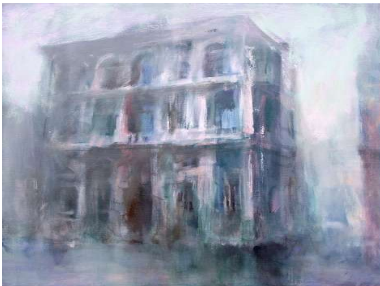
Palazzetto, 1997, olio su tela, 70x70 cm.