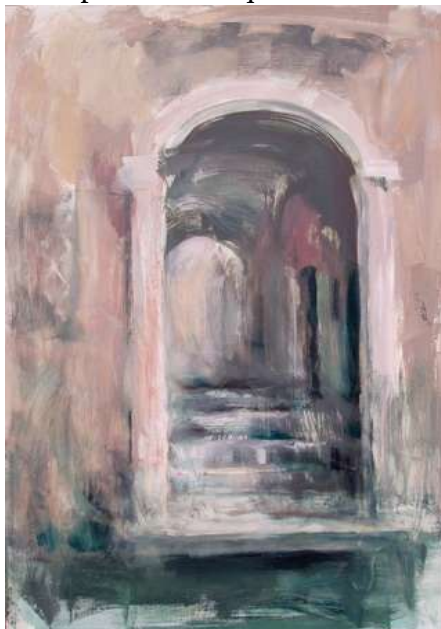
Paolo Del Giudice, Scalini, 2005 olio su tela, 90x60 cm.

Paolo Del Giudice è un attento osservatore. Ricerca le tracce lasciate dall'uomo nell'ambiente. Studia il paesaggio, ma non quello naturale; l'urbano. Si avvale spesso del mezzo fotografico per fermare le immagini che gli si mostrano nella vita quotidiana per poi reinterpretarle e fissarle nella pittura. Si passa quindi da rappresentazioni organiche ed unitarie di palazzi e ponti a frammenti, scorci e particolari della città, avulsi dal loro naturale contesto. Portoni sovrastati da lunette, bifore, balconi, elementi architettonici, quali trabeazioni, statue, scalinate, balaustre, muri a bugnato che sembrano emergere dal nulla, nell'originalità del