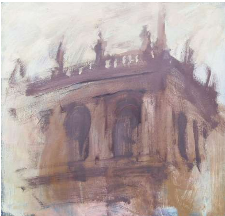
Controluce, 2005, olio su tela, 70x70 cm.