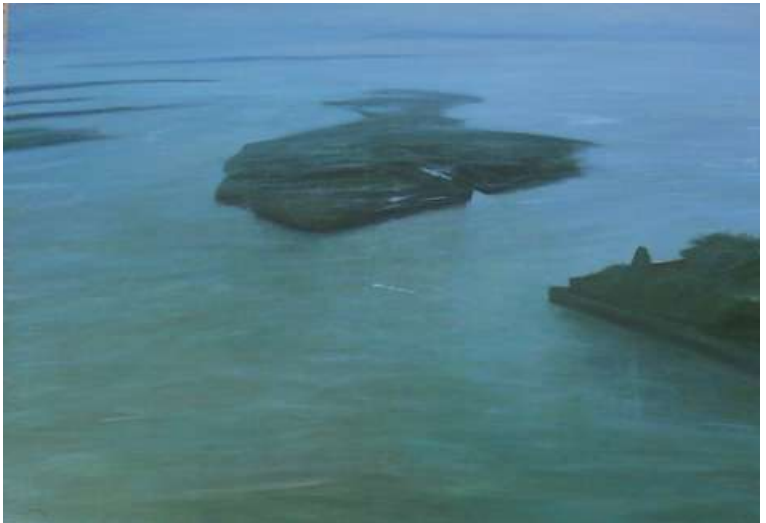
Isole, 2005, olio su tela, 90x130 cm.