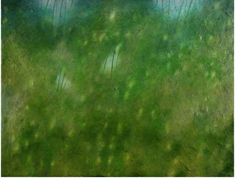
Verso sera, 2004, acrilico e olio su tela, 115x150 cm.