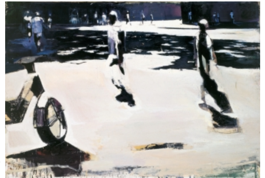
Viale Regina Margherita, 2000 olio su tela 134 x 200 cm