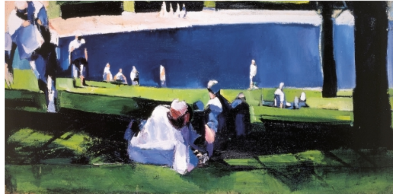
La vasca rotonda, 1999 olio su tela 98 x 196,5 cm