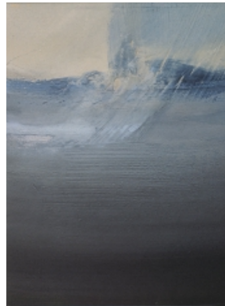
Nuvole, 1997 olio e tecnica mista su cartone 22 x 17 cm