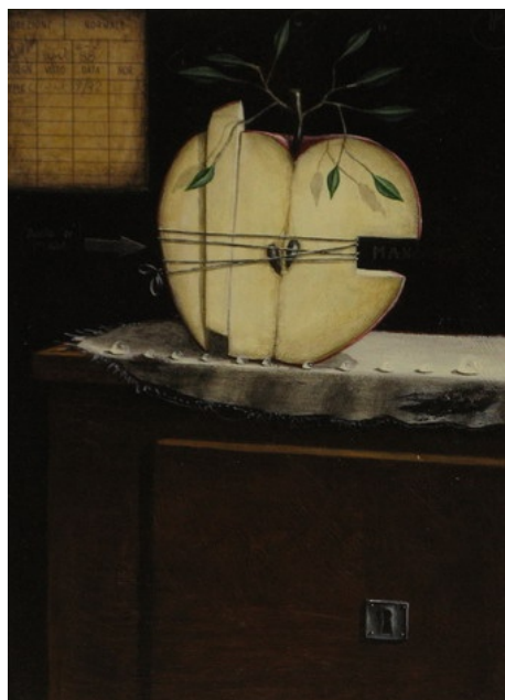
Virgilio (La Spezia 1967) Rimediare un errore tecnica mista su cartone 30x21 cm