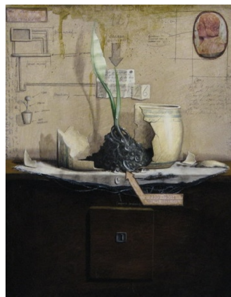
Virgilio (La Spezia 1967) Progetto mai realizzato di G. Bilancino tecnica mista su cartone 50x40