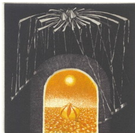
Il grande seme, 1998 acquaforte formato immagine 118x120 mm. formato foglio 215x215 mm. Tiratura: 100