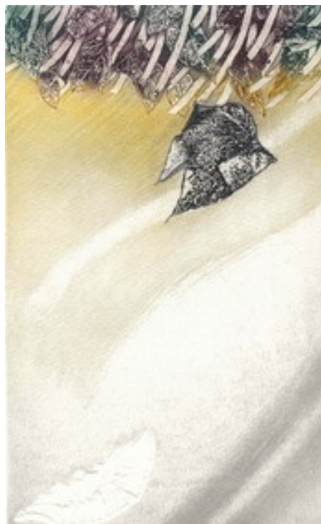
... nell'universo tempo ... , 2007 acquaforte formato immagine 235x150 mm. Formato foglio 350x250 mm. Tiratura: 60

I NOSTRI VIDEO SU COME SI REALIZZA UNA STAMPA D'AUTORE