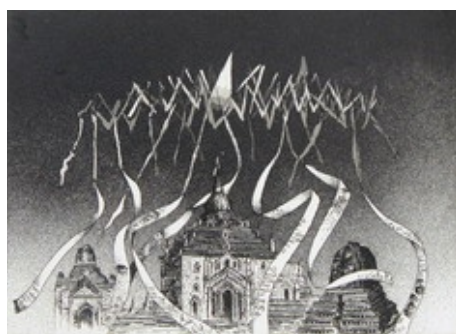
Bagan, 2010 acquaforte-acquatinta formato immagine 145x195 mm. formato foglio 300x410 mm. Tiratura: 65

Richiedete i prezzi delle grafiche a: galleria@ghiggini.it