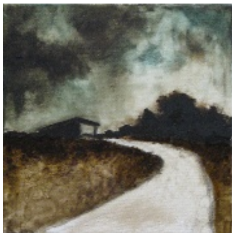
Luca Gastaldo (Milano 1983) Mattinata fredda tecnica mista su tela 40x40 cm.