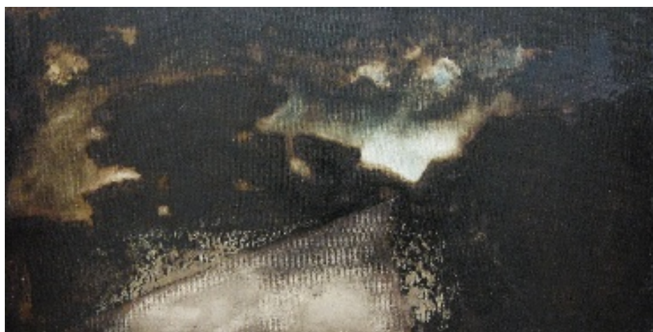
Luca Gastaldo (Milano 1983) Solo attraverso il buio tecnica mista su tela 80x40 cm