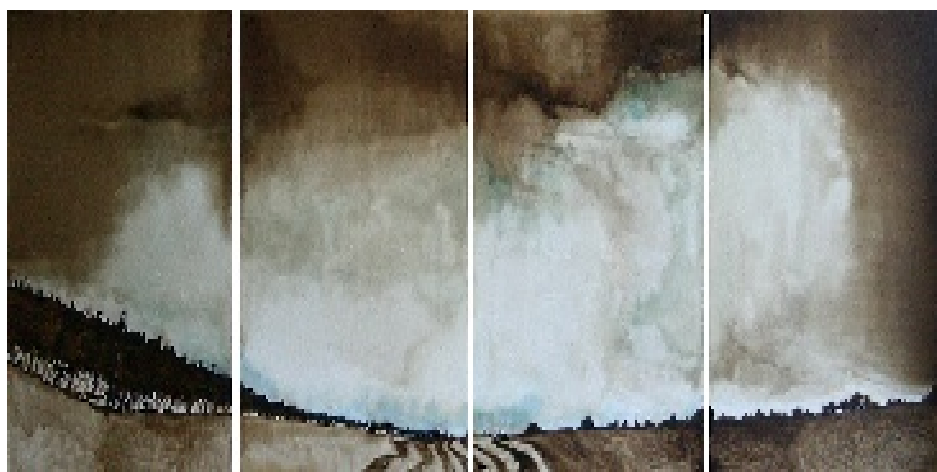
Luca Gastaldo Autunno 2009 tecnica mista su tela 150x400 cm.

Luca è artista di indubbi mezzi e di non comune onestà intellettuale. Senza strafare o cercare provvisorie strade di diversificazione, sta costruendo la propria poetica, ge-