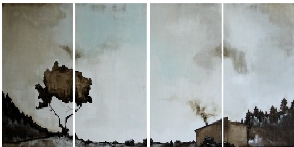
Luca Gastaldo Inverno 2009 tecnica mista su tela 150x400 cm.

Non è un Gastaldo diverso, è solo un giovane che sa coerentemente interpretare il suo 'essere artista', attingendo agli anfratti reconditi della poesia e superando la ristretta cronaca delle giornate.