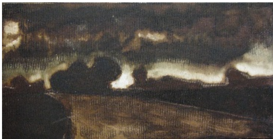
Luca Gastaldo (Milano 1983) Il giorno che nasce tecnica mista su tela 80x40 cm.