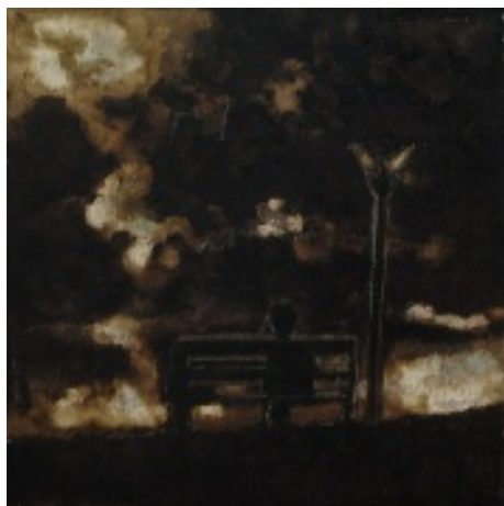
Luca Gastaldo (Milano 1983) Letture tecnica mista su tela 40x40 cm.