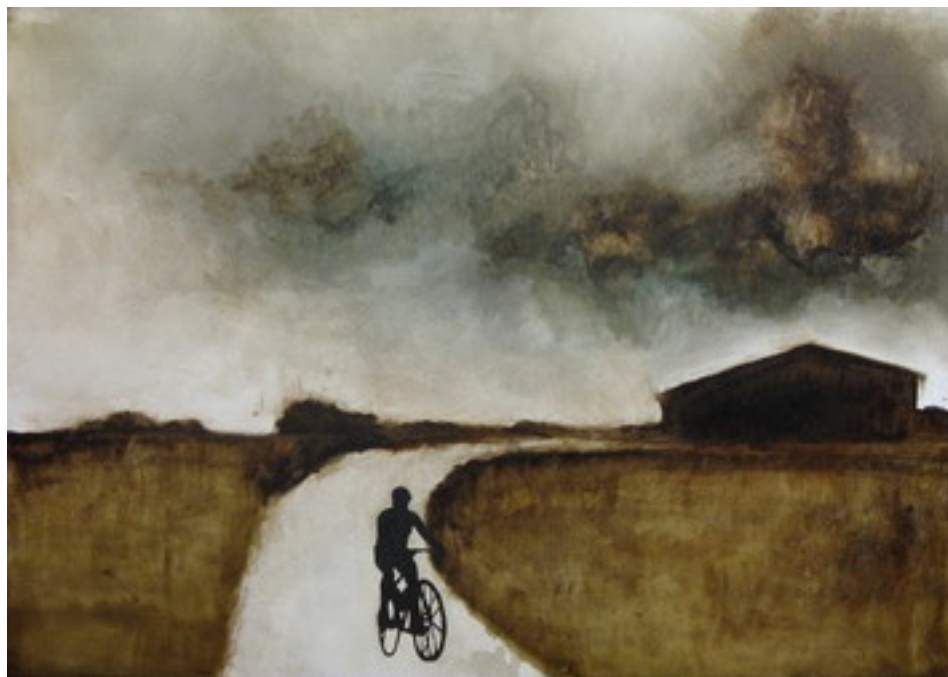
Luca Gastaldo (Milano 1983) Istante di chiarezza tecnica mista su tela 100x70 cm.