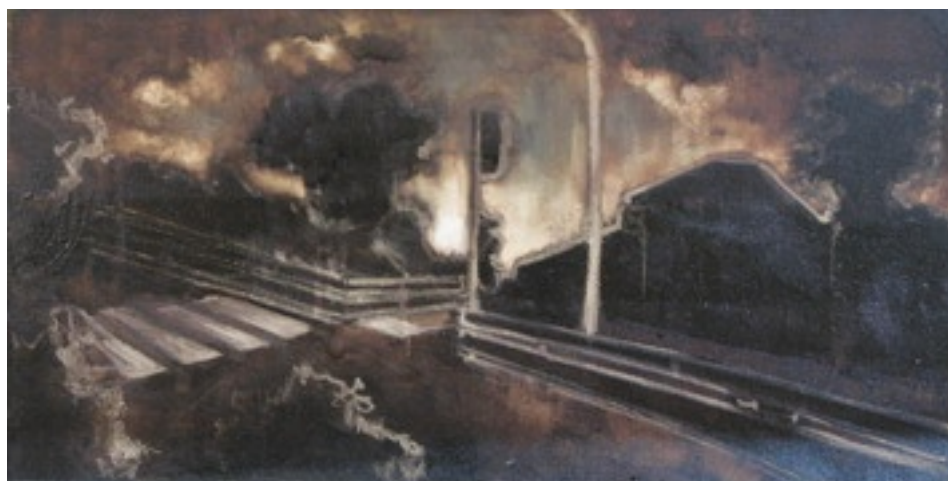
Luca Gastaldo (Milano 1983) Le ombre fuggono tecnica mista su tela 80x40 cm.

Recensioni Ettore Ceriani Licia Spagnesi