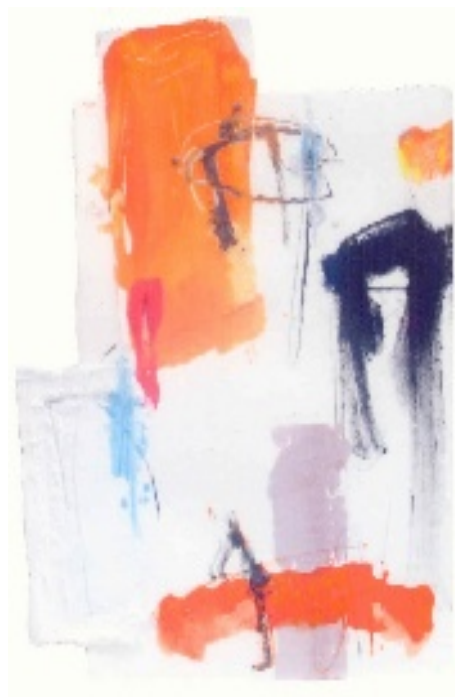
Enzo Esposito (Benevento 1946) Senza titolo, 2004 tecnica mista su cartoncino 51,5 x 46 cm.

Il periodo successivo è segnato da un espressionismo astratto che si esprime attraverso accese luminosità coloristiche e campiture sempre più ampie, sorrette da una idea di geometria nascosta. Esposito in questi anni ha partecipato a importanti rassegne internazionali e ha esposto in numerose città italiane ed europee.