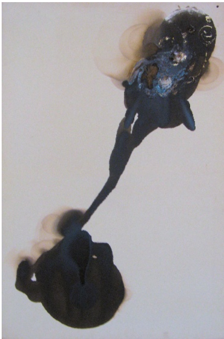
Silvia Colombo (Desio 1982) A proposito di distanza 2007

bitume di giudea, diluente e gesso su tela 120x80 cm.