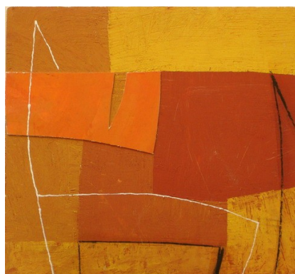
Tommaso Cascella (Roma 1951) Segreta Simmetria, 2004 Tecnica mista su tela 40 x 40 cm.

I dipinti di Cascella (li chiamiamo dipinti per pura comodità, visto che incombono sempre elementi tridimensionali) non hanno né inizio né fine; né alto né basso; né centro né periferia e vanno colti nella loro totalità come luoghi della pittura, come spazi della mente in grado di modificarsi di fronte allo sguardo complice di chi li osserva.