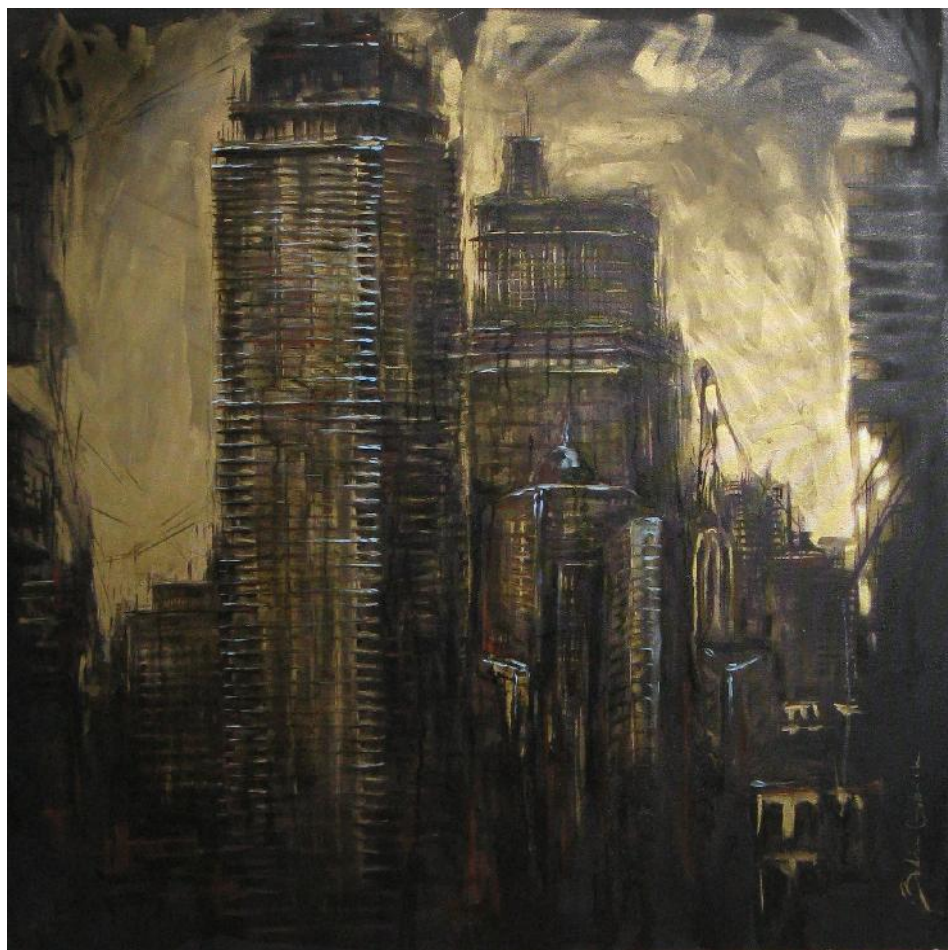
Composso del verticalismo tecnica mista su tela 100x100 cm