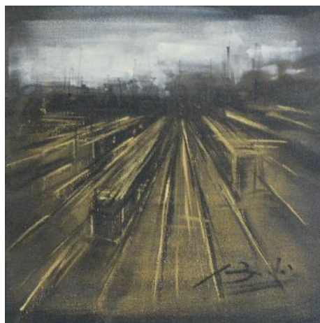
Senza titolo tecnica mista su tela 30x30 cm