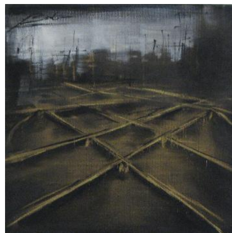
Senza titolo tecnica mista su tela 30x30 cm