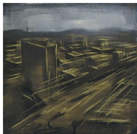
Senza titolo tecnica mista su tela 30x30 cm