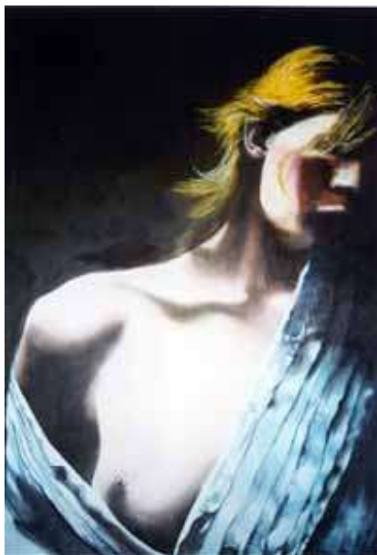
Laura Lo Piccolo Senza titolo, 2002 acrilico su tela, 150x100 cm.