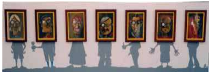
Simone Berrini I sette tizi capitali, 2002 tempera su legno, 150 x 45 cm.