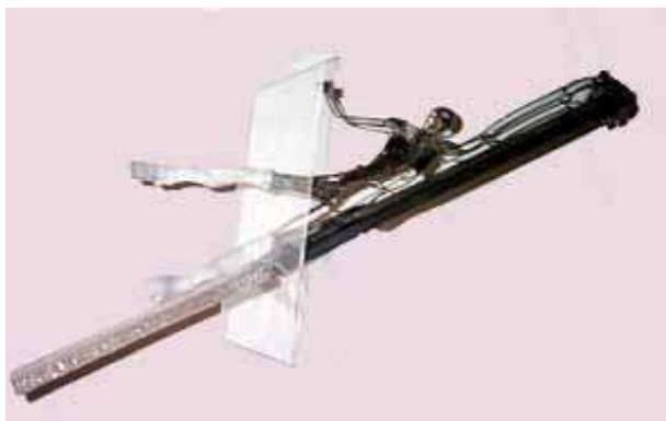
Guglielmo Arrighi Senza titolo, 2002 ferro, plexiglas e resina, 45x95x33 cm.