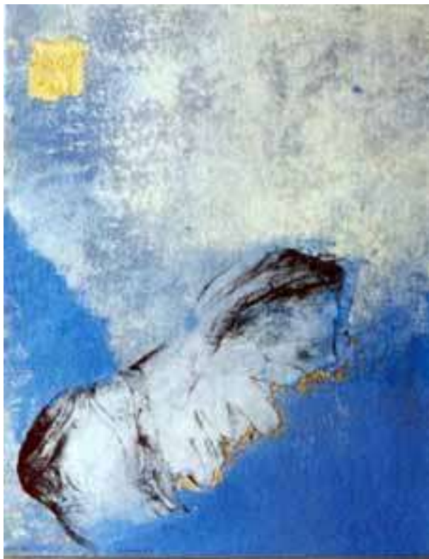
Senza titolo, 2002 acrilico su tela, 77x222 cm.