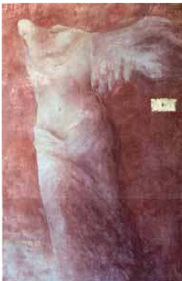
Vittoria, 2002 acrilico su tela, 194x129 cm.