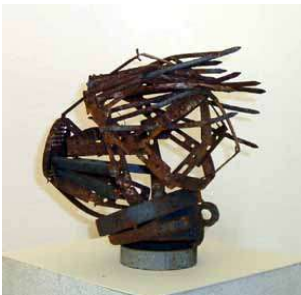
Francesco Gibin, Senza titolo, 2002 ferro, 30x28x23 cm.