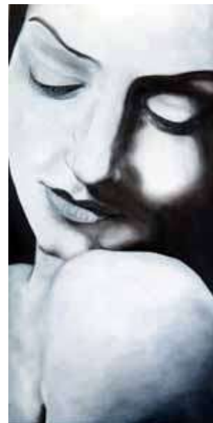
Laura Lo Piccolo Senza titolo, 2002 acrilico su tela, 120x60 cm.