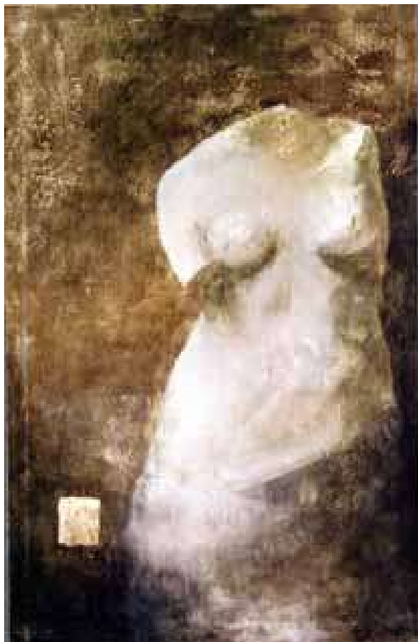
Senza titolo, 2002 acrilico su tela, 160x110 cm.