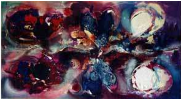
Deborah Nogaretti Confronti, 2002 tecnica mista su tela, 104 x 57 cm.