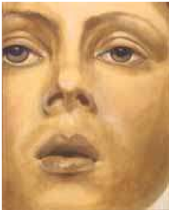
Anna Siva Senza titolo, 2002 olio su tela, 100x80 cm.