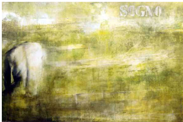
Senza titolo, 2002 acrilico su tela, 85x126,5 cm.