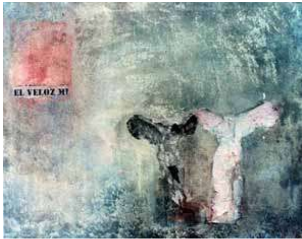
Manifesto, 2002 acrilico su tela, 65x81 cm.