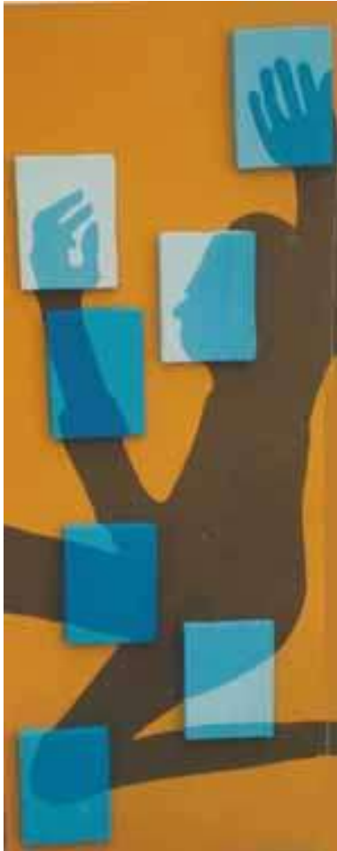
Simone Berrini Opera bene aperta , 2002 tempera su legno e tela tela, 110x50 cm.