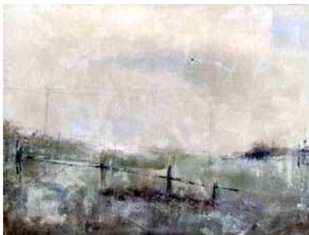
A Requena, 2001 acrilico su tela, 89x116 cm.