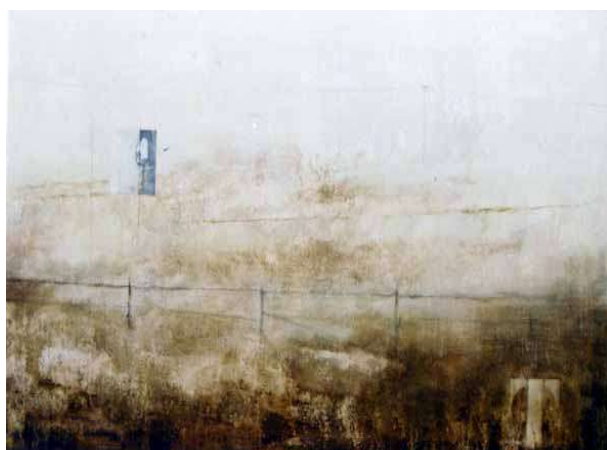
Senza titolo, 2002 acrilico su tela, 87x142 cm.