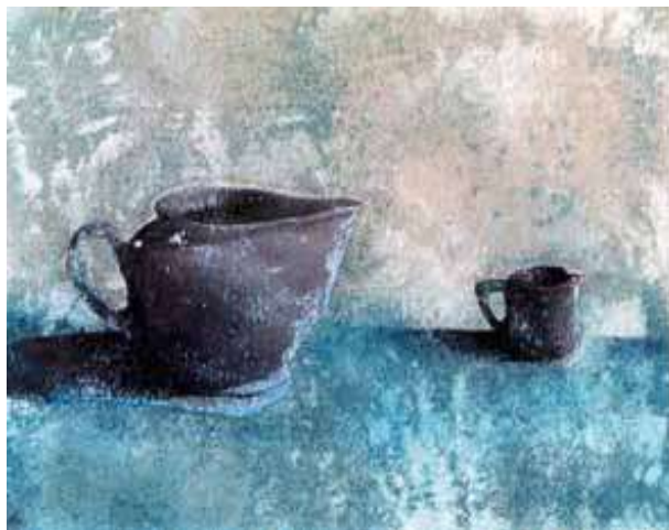
Senza titolo, 2002 acrilico su tela, 24x33 cm.