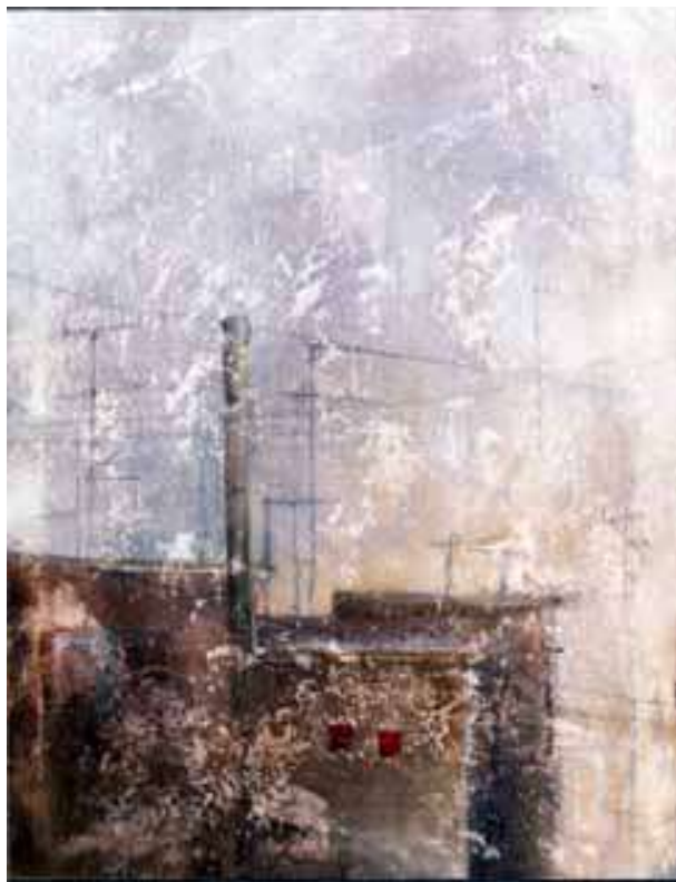
Paesaggio, 2002 smalto e acrilico su tela, 60x50 cm.