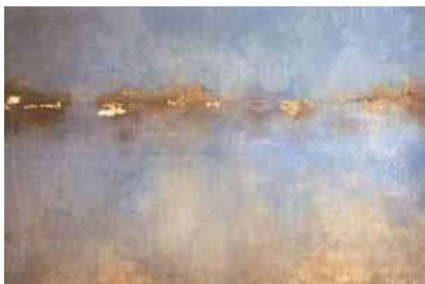
Albufera, 2002 acrilico su tela, 130x195 cm.