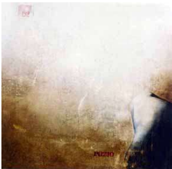
Alba, 2002 acrilico su tela, 44x45,5 cm.