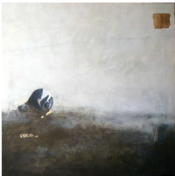
Solo, 2002 acrilico su tela, 100x100 cm.