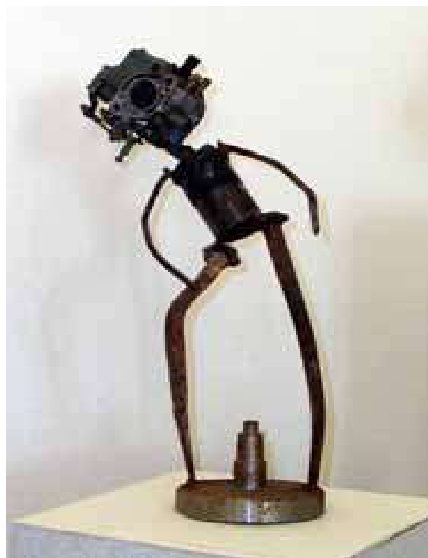
Francesco Gibin, Senza titolo, 2002 ferro, 50x17x13 cm.