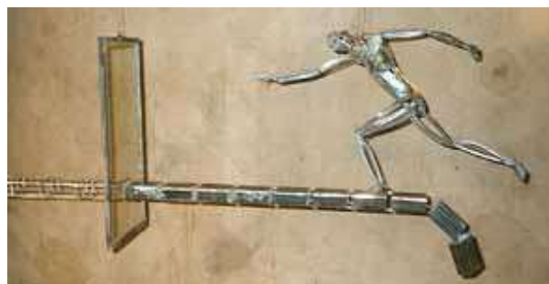
Guglielmo Arrighi Senza titolo, 2002 ferro, plexiglas e resina, 70x125x22 cm.