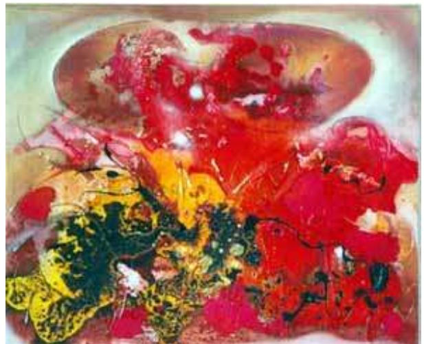
Deborah Nogaretti Esplosione di un'alba, 2002 tecnica mista su tela, 58 x 70 cm.